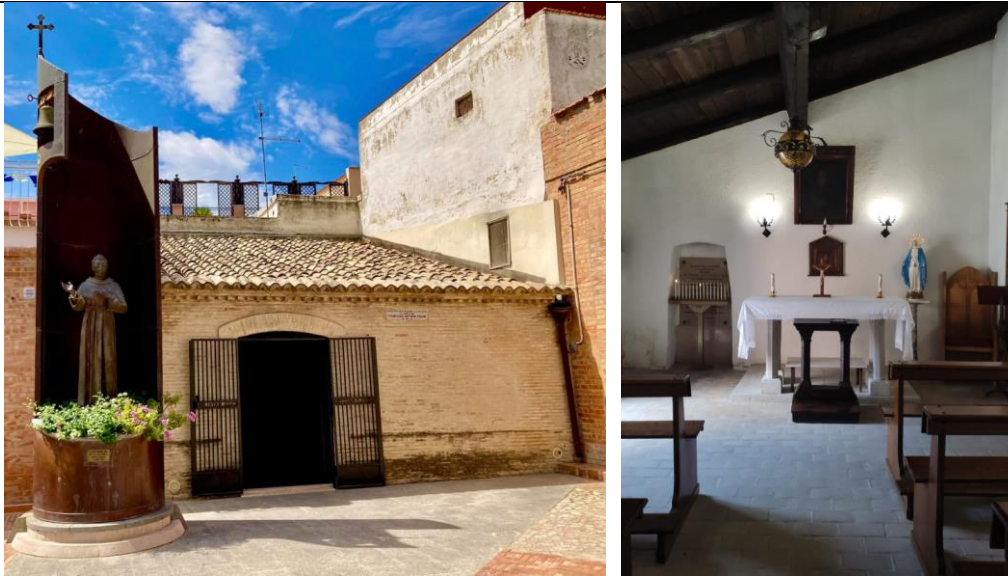
Esterno e interno della casa natale del Padre Maestro Fasani