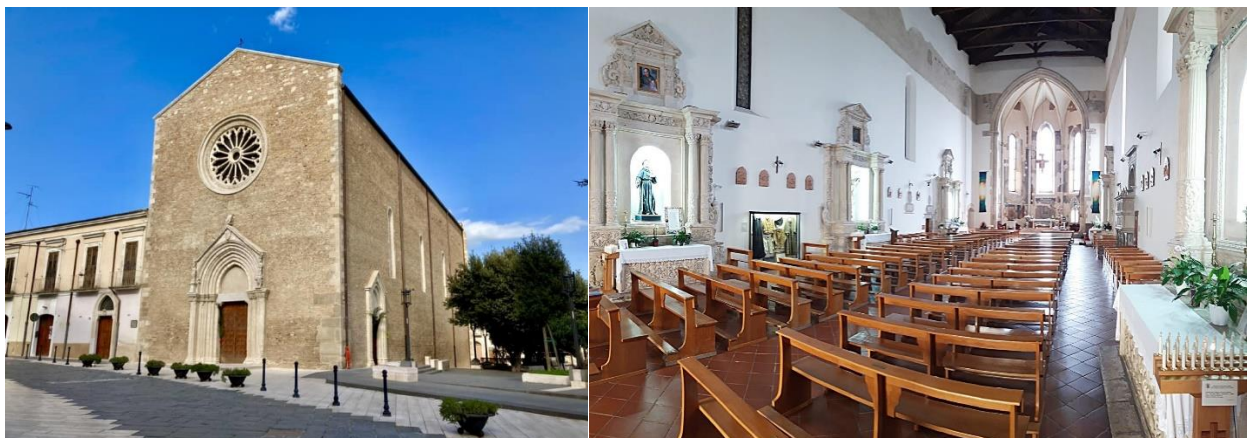
Esterno e interno della Basilica-Santuario

Ubicazione/Sito: Basilica-Santuario in piazza Tribunali e casa natale del Fasani in via Torretta a Lucera (FG).