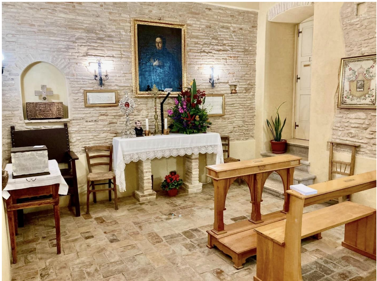
Cella dove morì il Padre Maestro Fasani