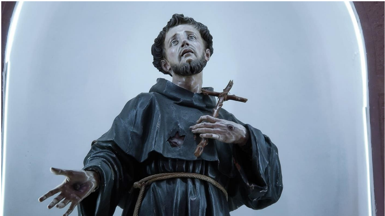
Particolare della statua lignea di S. Francesco d'Assisi (G. Colombo, 1713)