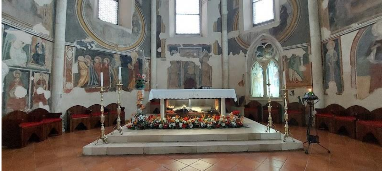
Abside con altare e urna del Padre Maestro Fasani

Nel 2001 la chiesa è stata elevata a santuario diocesano di S. Francesco Antonio Fasani. Nel 2008 il santuario è stato riconosciuto come “Monumento Testimone di una Cultura di Pace” dal Club UNESCO. L’11 maggio 2012 ha ottenuto il titolo di basilica minore, proclamato ufficialmente il 29 novembre dello stesso anno alla presenza del cardinale Giuseppe Bertello.