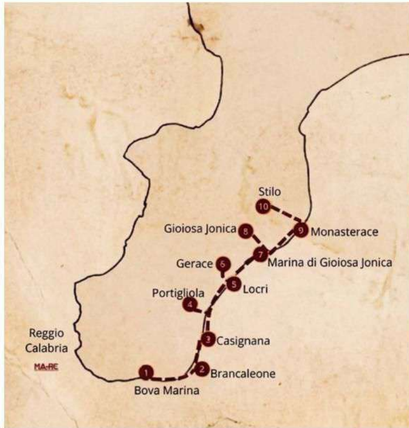
ITINERARIO I 70 KM D'ORO