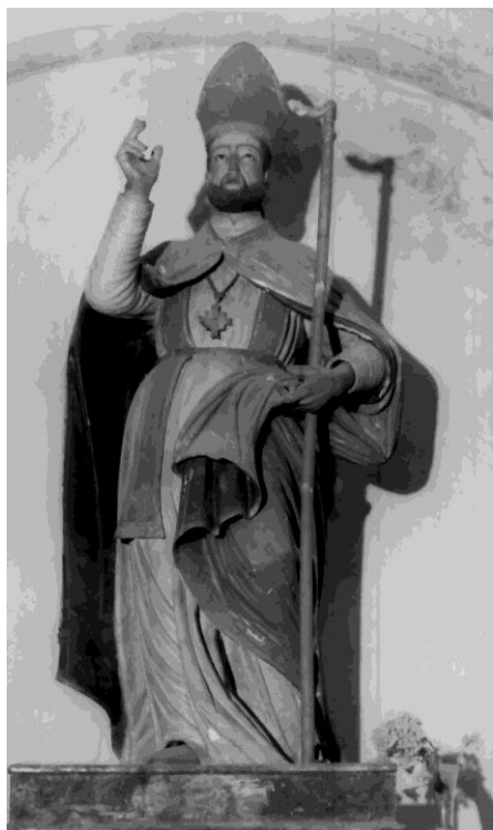
Immagine fotografica dell’Opera d’Arte